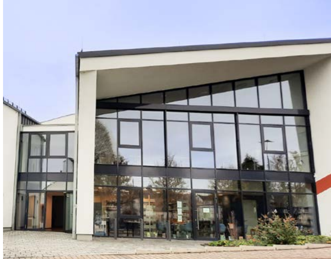
KÖB St. Lambertus Halsenbach im Bürgerzentrum