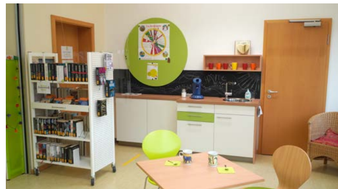
KöB St. Elisabeth Karlsruhe

Die Rahmenempfehlungen beschreiben das Anforderungsprofil einer zeitgemäßen Katholischen Öffentlichen Bücherei. Alle Aspekte der Büchereiarbeit – vom pastoralen Auftrag über die räumliche und technische Ausstattung bis hin zu einem modernen zeitgemäßen Auftritt – sind in den Blick genommen. Die Empfehlungen verstehen sich dabei in erster Linie als Hilfestellung. In 18 Kriterien steht den Trägern wie den ehrenamtlichen Büchereiteams eine zukunftsweisende Orientierung bereit.